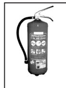
6 kg Pulverlöscher