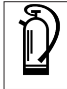
Kohlendioxid CO 2

Bei elektronischen Anlagen können selbst Schmorbrände, z.B. durch Brandrauch, große Schäden, manchmal sogar Totalschäden verursachen. Bei Löschnmaßnahmen können ungeeignete Löschmittel erhebliche Schäden an den Anlagen hervorrufen. Zusätzlich zum hohen Sachschaden kann der Ausfall der elektronischen Anlage für das Unternehmen eine bedrohliche Betriebsunterbrechung zur Folge haben.